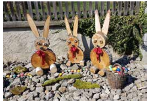
Eine Freude ... Danke!