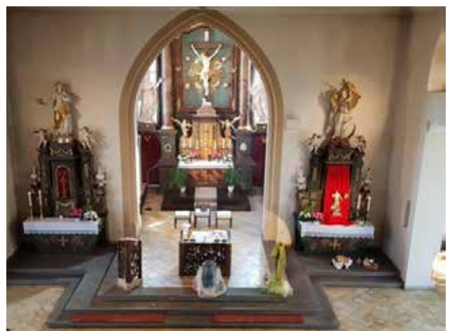
Der Gottesdienst am Ostersonntag wurde per „Zoom“ (Internetplattform) übertragen – Danke!