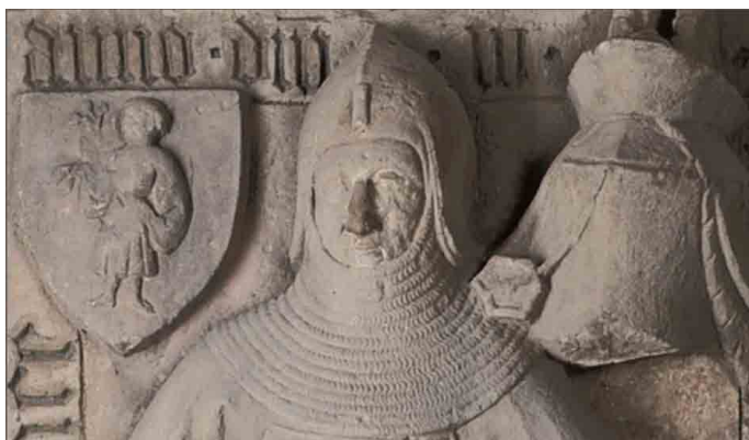
Kunst aus dem Kloster Heiligenthal Sonderpräsentation im Rittersaal