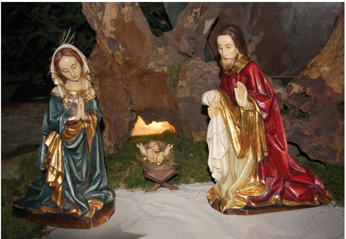
Krippe in der Kirche „St. Michael“ in Schwanfeld

Gesegnete Weihnachten und ein friedvolles, gesundes und erfolgreiches Neues Jahr 2009