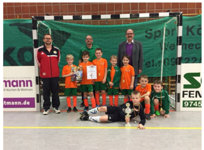
Sieger U9: SV Kürnach