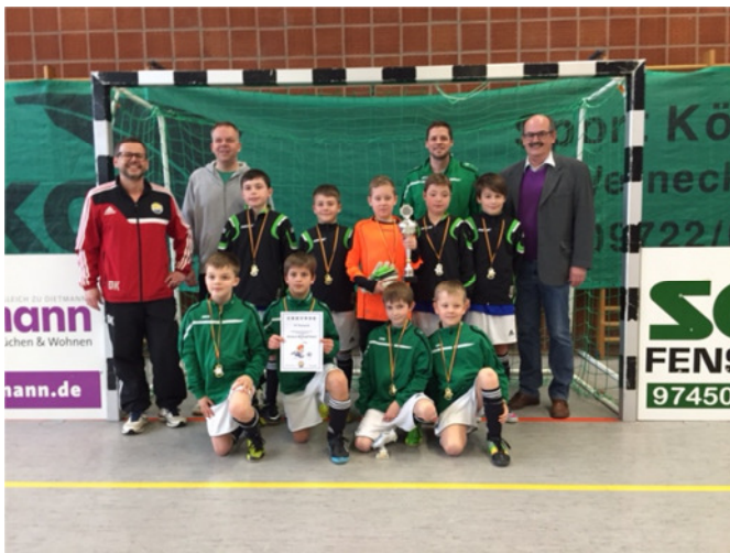
Sieger U11: SV Kürnach