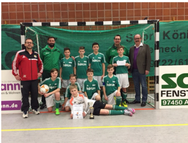
Sieger U13: SV Kürnach