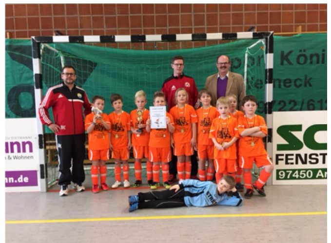
Sieger U8: SG Prülsdorf/Untersteinbach