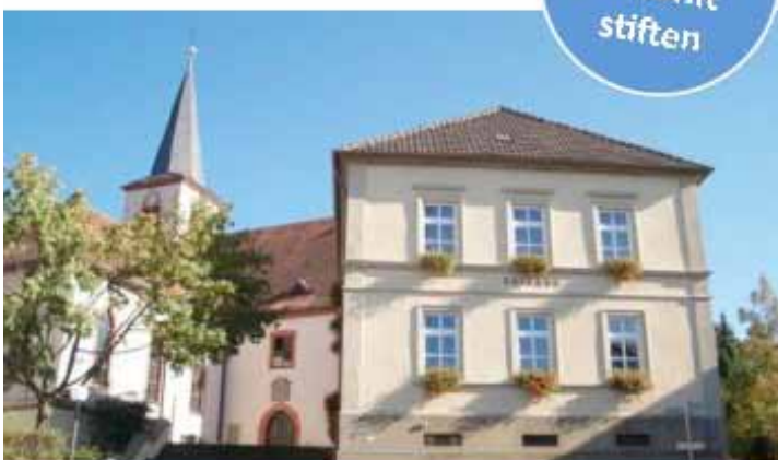
Die Bürgerstiftung Schwanfeld ist eine Stiftung in der Stiftergemeinschaft der Sparkasse Schweinfurt