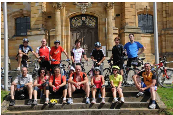
Gez. Uwe Sauer