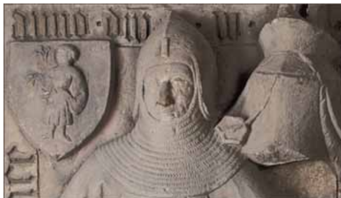
Kunst aus dem Kloster Heiligenthal Sonderpräsentation im Rittersaal

Wie bereits ausführlich im Kembach Kurier Nr. 06 vom 13.03.2014 angekündigt, werden wir am Samstag, 12.04.14, das Mainfränkische Museum Würzburg besuchen, um die Sonderausstellung über Kloster Heiligenthal zu besichtigen, die vom 8. April bis zum 4. Mai 2014 zu sehen ist.